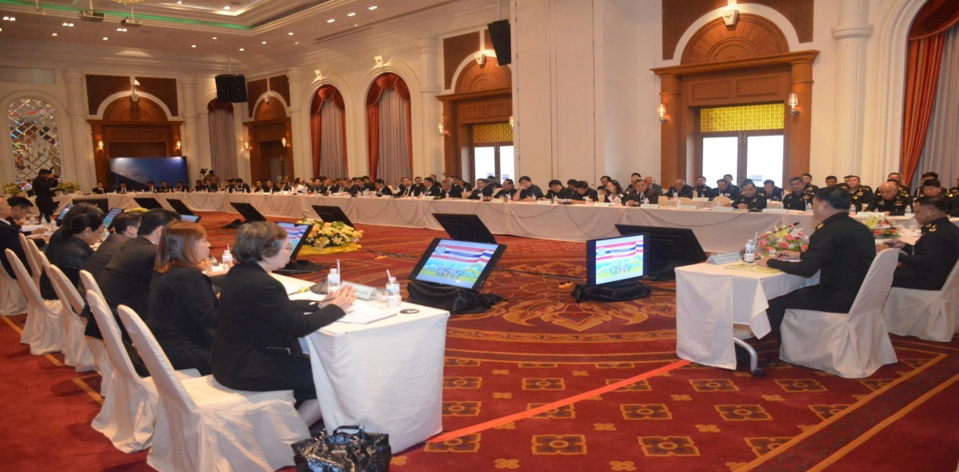
การจัดเวทีรับฟังความคิดเห็นจากทุกภาคส่วนทั่วประเทศ