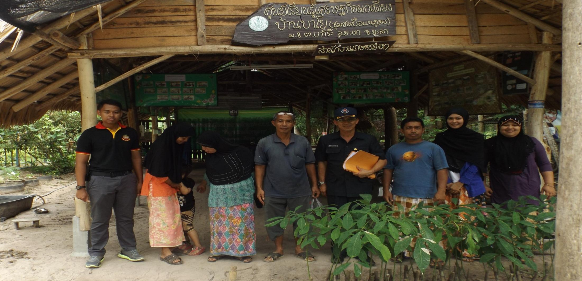
หลักปรัชญาของเศรษฐกิจพอเพียง