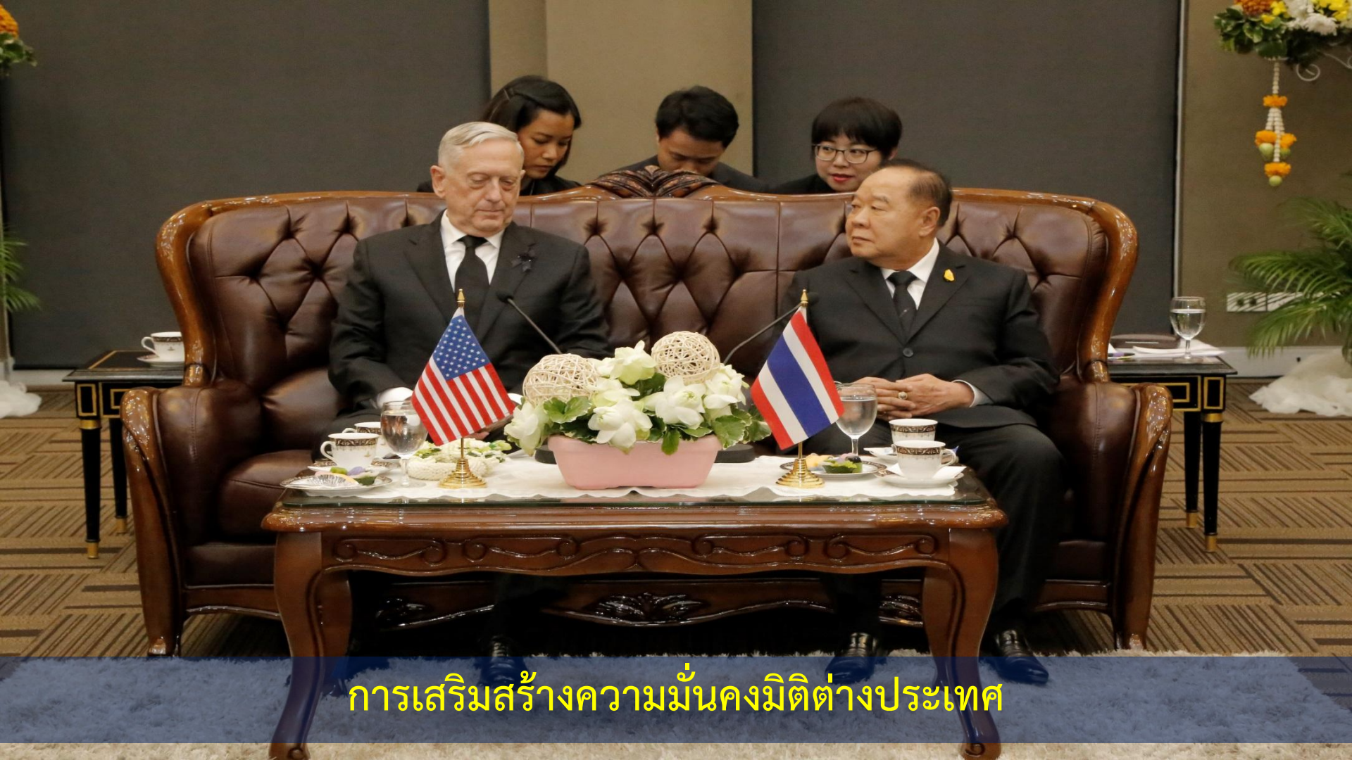
การเสริมสร้างความมั่นคงมิติต่างประเทศ