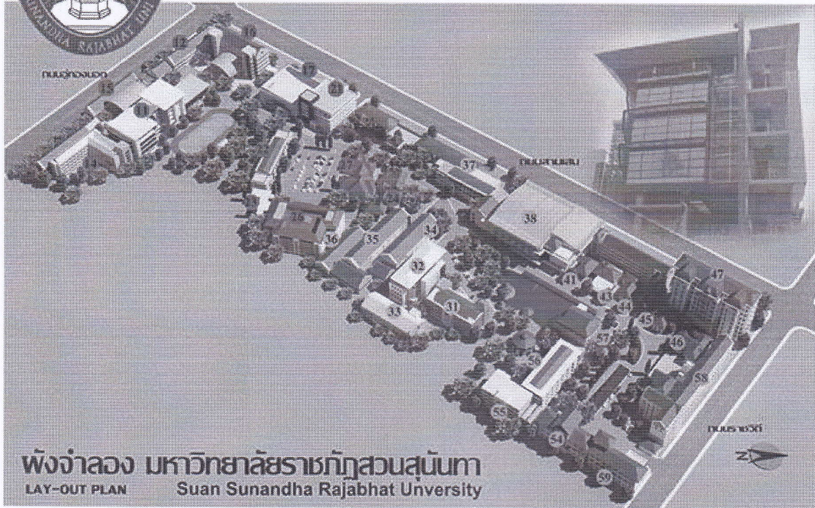
ผังจำลอง มหาวิทยาลัยราชภัฏสวนสุนันทา LAY-OUT PLAN Suan Sunandha Rajabhat University