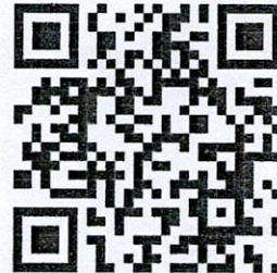
แบบกรอกประวัติ 2 แบบ